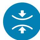
Short corridor available